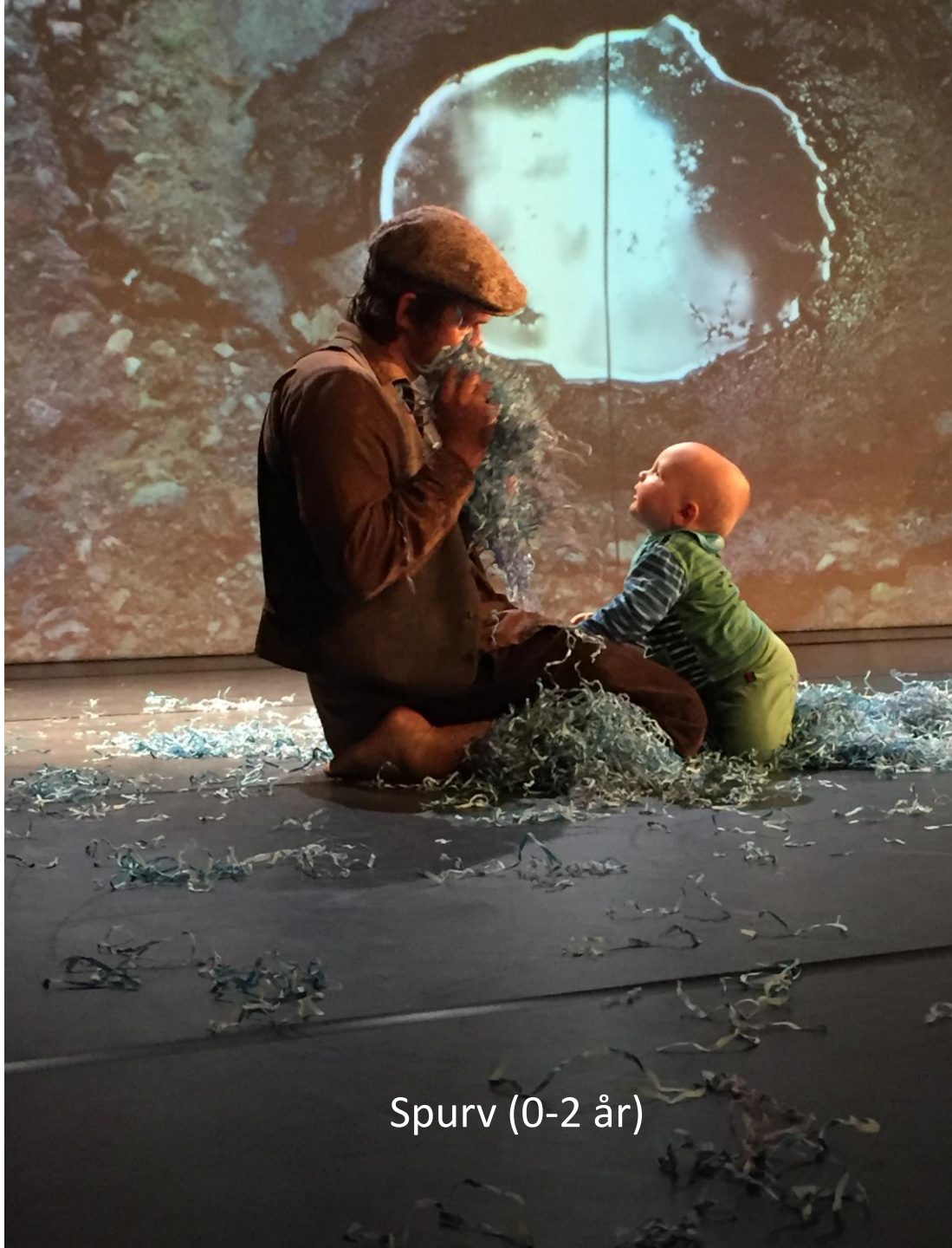
Spurv (0-2 år)